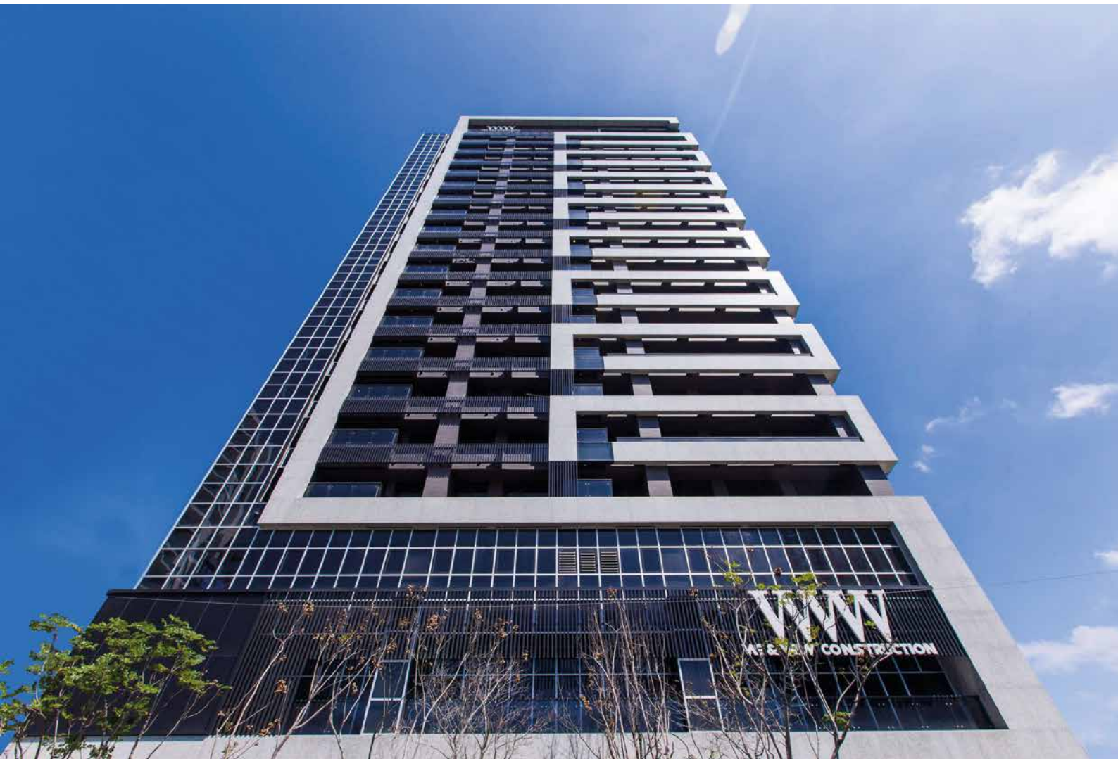
【聯上聯實景圖】-新北·新莊副都心